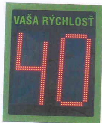
Pozn.: ilustračné foto